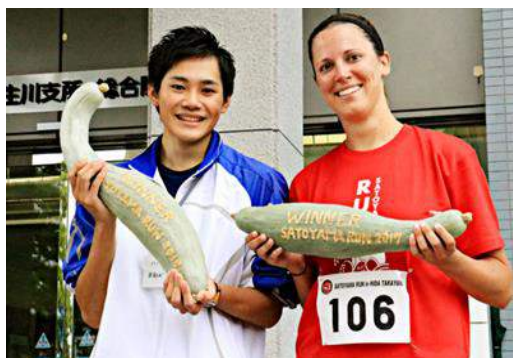
特産「宿讎（すくな）カボチャ」のトロフィー ※ハーフマラソン優勝者