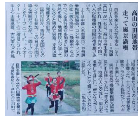
翌日の新聞記事に取り上げていただきました