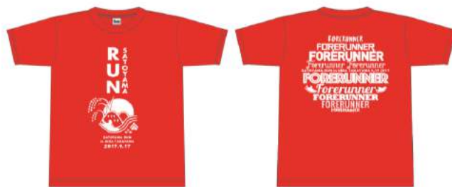
第0回大会記念Tシャツ